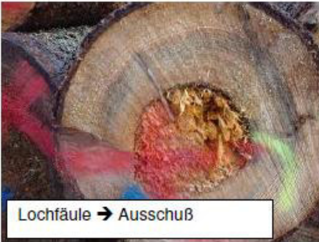
Lochfäule → Ausschuß