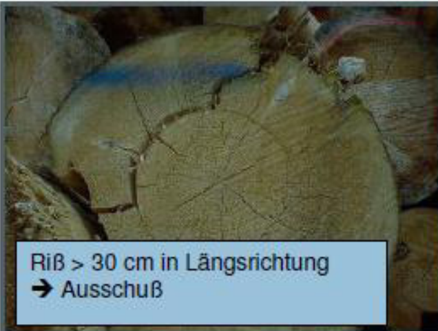
Riß > 30 cm in Längsrichtung → Ausschuß