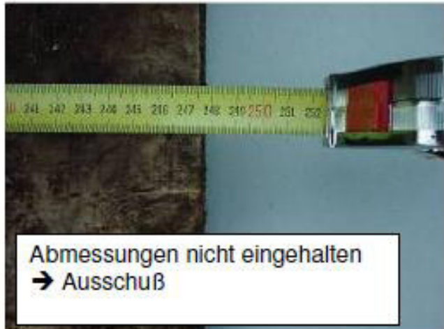
Abmessungen nicht eingehalten → Ausschuß