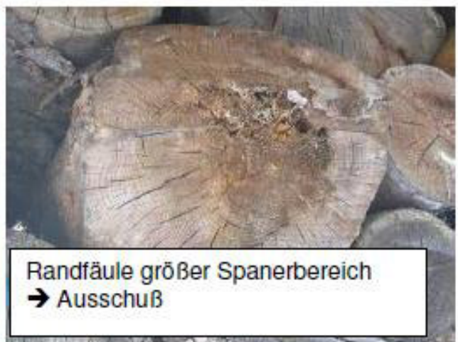
Randfäule großer Spannerbereich → Ausschuß