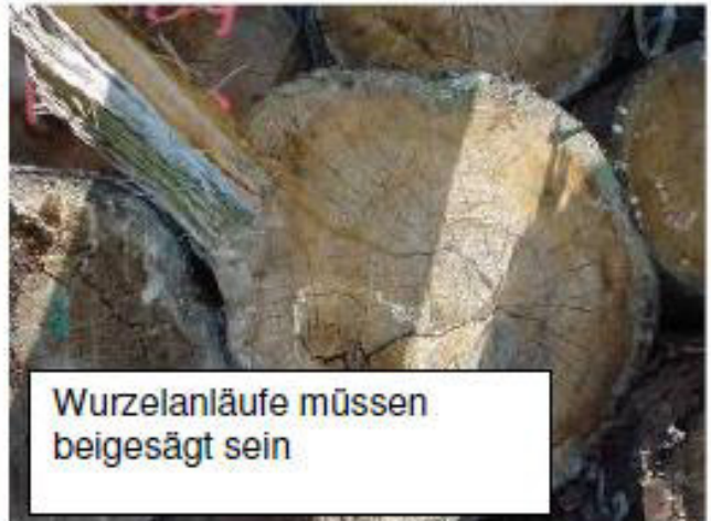
Wurzellanläufe müssen beigesägt sein