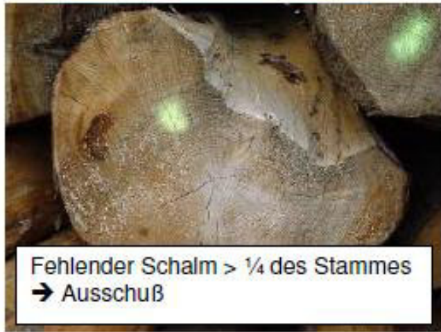
Fehlender Schalm > 1/4 des Stammes → Ausschuß