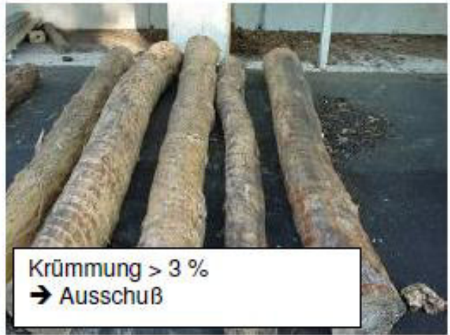
Krümmung > 3 % → Ausschuß